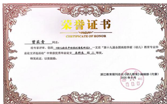
部分学生毕业论文获奖证书