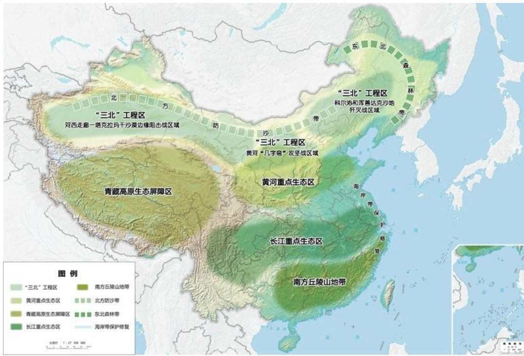
图3 重要生态系统保护和修复重大工程布局图