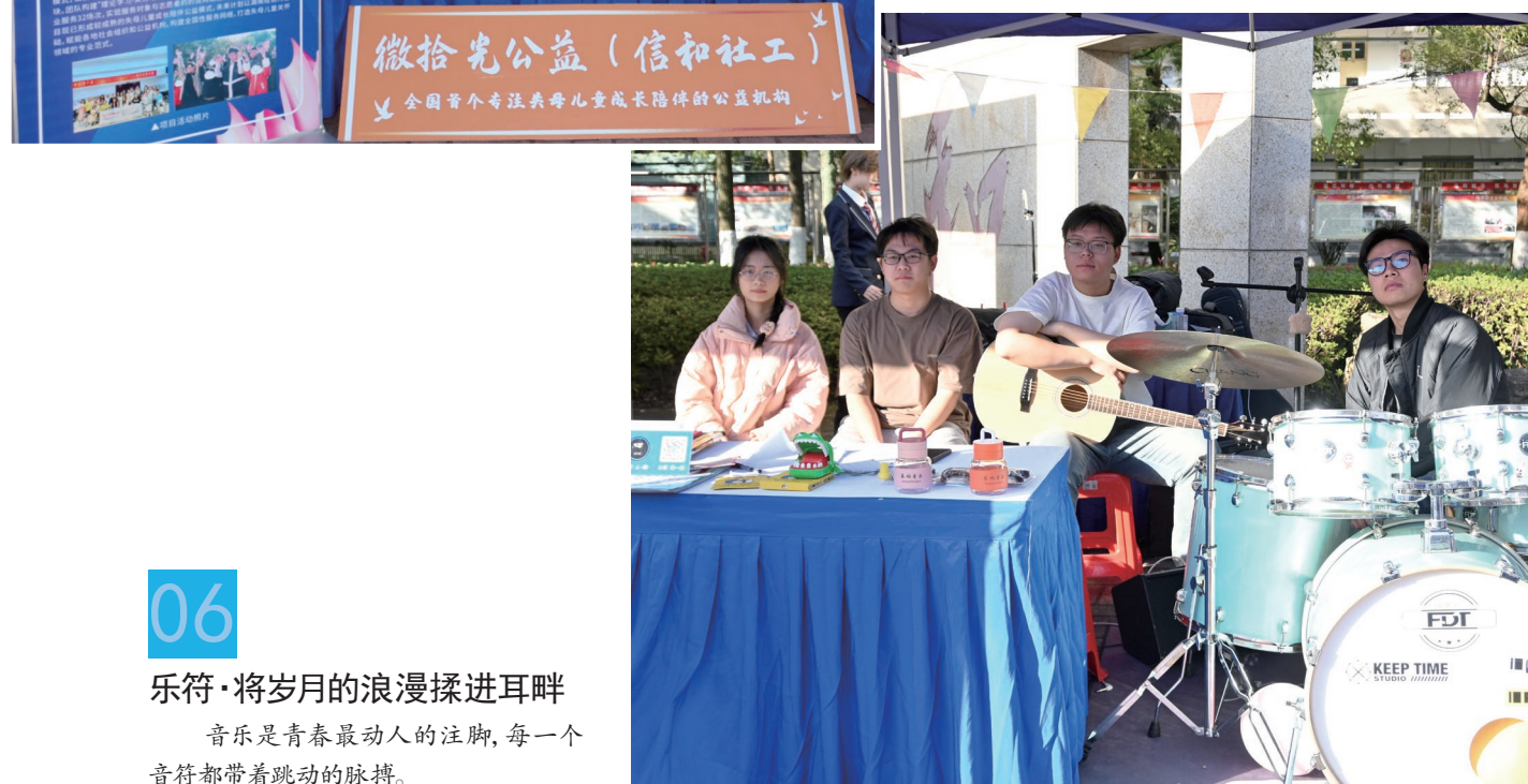
06 乐符·将岁月的浪漫揉进耳畔 音乐是青春最动人的注脚，每一个音符都带着跳动的脉搏。