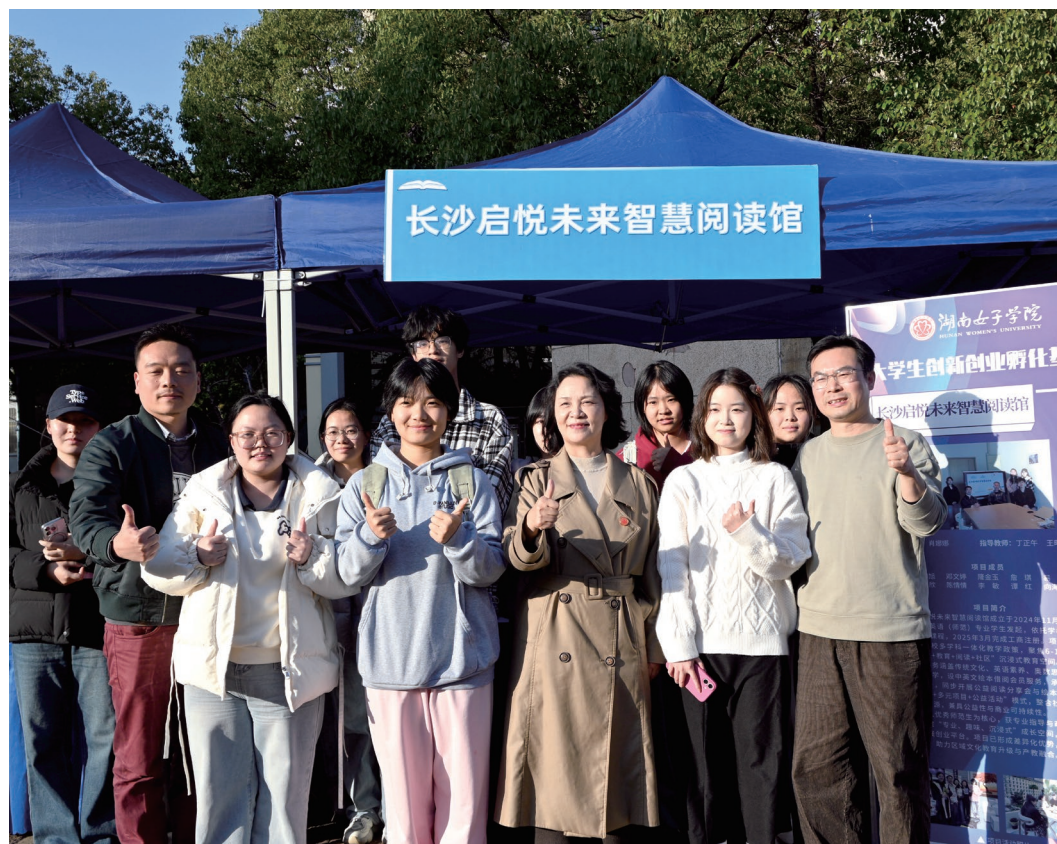
07 智慧阅读·无界书海 指尖轻触屏幕便能跨越山海，将古今中外的万卷书香，浸入眉眼，创业的种子已播撒。未来的征途，愿我们带着这份初心与热忱，敢闯敢试，向阳生长。