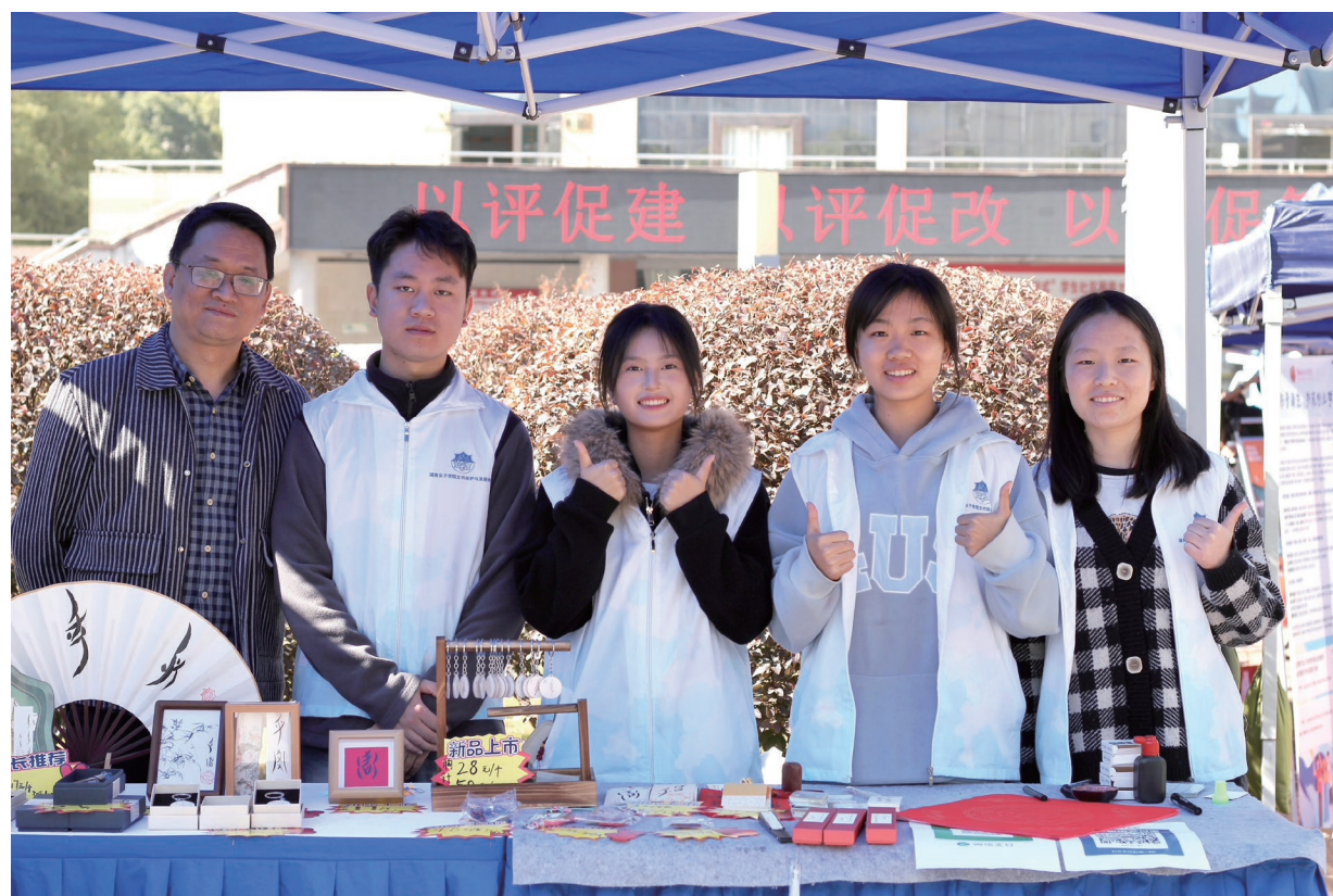
02 女书·古老文字 v.s 青春符号 千年女书，墨韵流芳。每一个字符都藏着美学的极致浪漫。