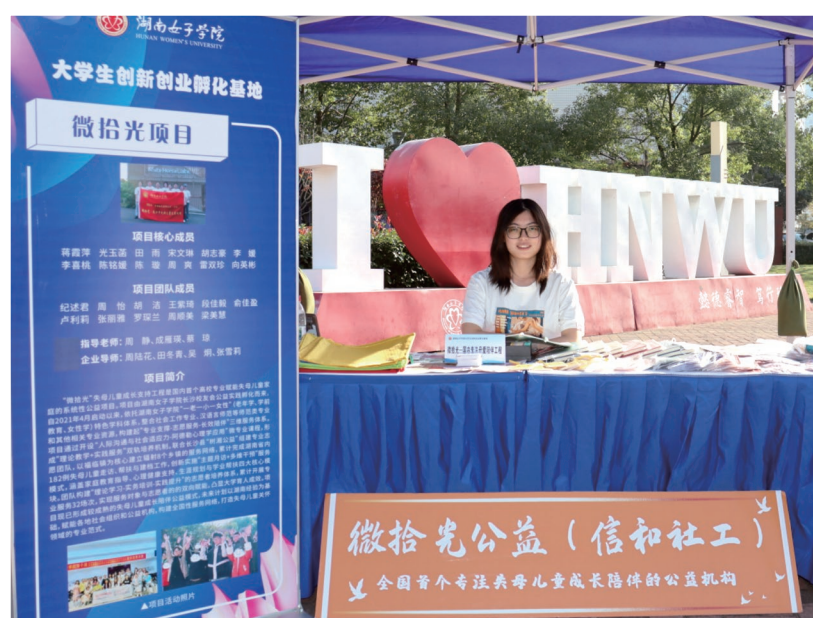
05 温暖护航·把安全融入日常 以微光护童心，用专业守女童性健康安全。为纯真童年筑牢防线，每一次陪伴都是爱的滋养，每一次互动都是成长的赋能。