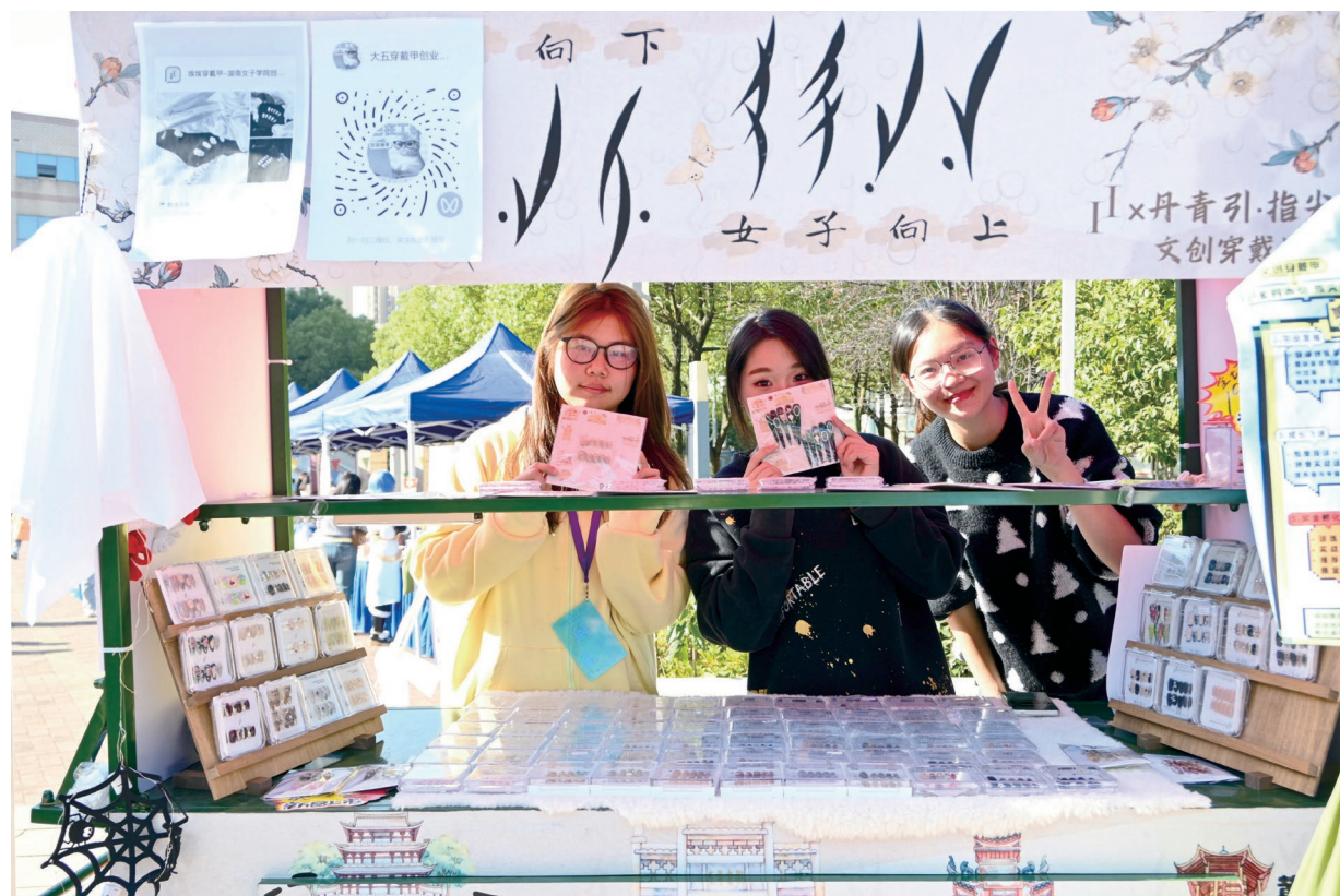
04 串饰·将四季的温柔缀满掌心 风掠过四季，把温柔揉进串饰里。一枚简约串饰将四季的流转与温柔细细缀满掌心。一副穿戴甲将色彩凝于方寸甲面，每一寸光泽都恰到好处。