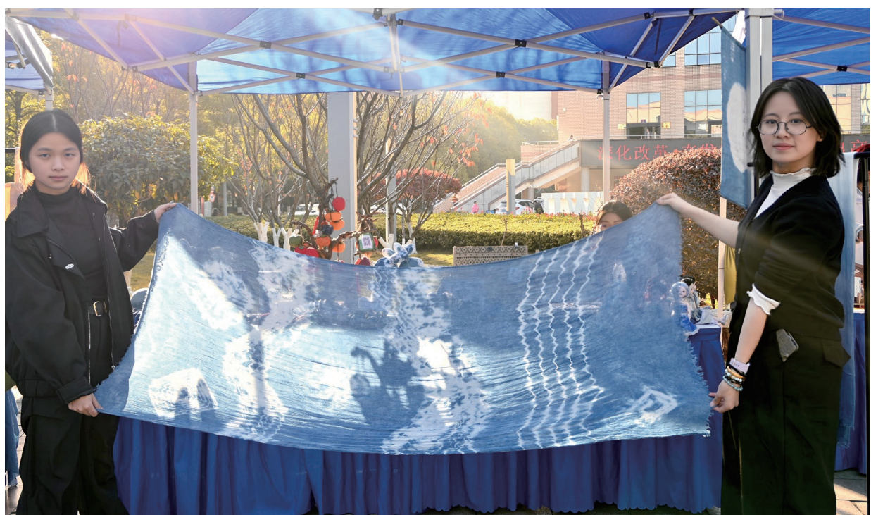
03 织染·把童话的颜色染进生活 一枝一叶，是自然的拓印。铺开素白的布袋，拾起刚落的枫叶、桂叶。指尖轻摆便把秋的形状嵌进布料里。蓝白之间是非遗的浪漫，靛蓝的染液在织物上晕开，像把整片天空揉进了布面。