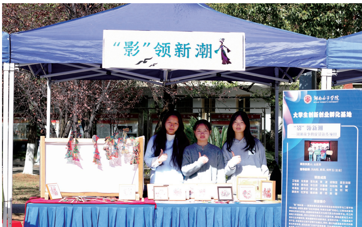
01 皮影·让幕布后的故事“活”在当下 小巧的皮影造型，用牛皮精心雕刻再上色。纹理细腻，色彩鲜亮。学习简单的皮影动作，感受“幕后操控”的乐趣。

蓝帐篷在文化广场支起一方天地。为期两天的大学生创业市集人潮涌动。手作藏着温度，创意迸发火花，这里正撒播着创新创业的种子。