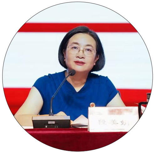
段美娟对新生提出三点殷切期望：一要砥砺前行，高扬青春理想风帆；二要练就本

本报讯（学生工作部 林心童 童思奕 谢雅菲）金秋送爽，丹桂飘香。九月的湖南女子学院，迎来了朝气蓬勃的 2025 级新同学。9 月 17 日，学校隆重举行新生入学教育报告会，校党委书记段美娟为全体新生作题为《志存高远，砥砺前行，以青春之我筑梦伟大新时代》的主题报告。 报告伊始，段美娟书记以“今年是中国人民抗日战争暨世界反法西斯战争胜利 80 周年”为切入点，深情回顾了革命先辈用生命和信念换来今日山河无恙、国泰民安的伟大历程。她在报告中强调，要在传承红色基因中坚定理想信念，让信仰之光照亮青春之路；要在厚植爱国情怀中担当时代责任，以青春热血书写报国志；要在激情奋斗中绽放青春光彩，以实干精神成就卓越人生。