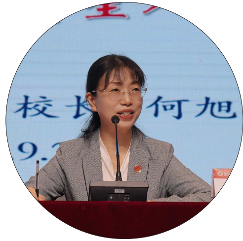
认识”，自觉做到明大势、担大任。她向新生提出四点期望：一是明确发展目标，树

本报讯（学生工作部 林心童）9 月 22 日上午，我校在体育馆举行 2025 级新生入学教育系列报告会。党委副书记、校长何旭娟作专题报告，全体 2025 级新生、相关部门负责人和新生辅导员参加。 何校长首先代表学校向全体新同学表示热烈欢迎。她从“心忧天下、敢为人先”的湖湘精神谈起，鼓励大家传承红色基因、厚植家国情怀。随后，何校长用“小、美、特、精”四个字介绍了学校的特点以及学校正在奋发图强、向建设高水平应用型大学这一目标迈进的情况。 何校长指出，面对世界百年未有之大变局，立足以中国式现代化全面推进中华民族伟大复兴这一新征程，同学们应牢记习近平总书记对大学生提出的“四个正确